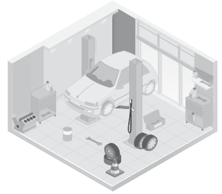
Car Repair Shop